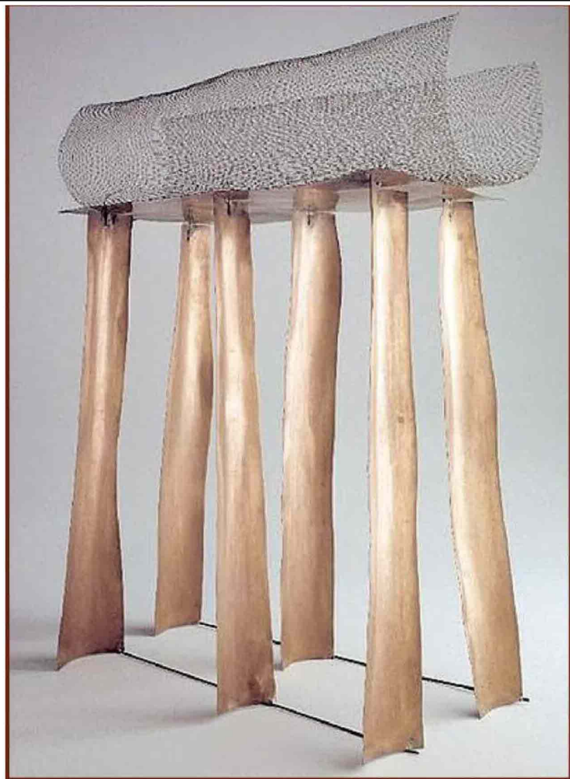
VENERE "Monumento al nulla" (1972 - Rame e Inox - courtesy La Triennale e Fondazione Melotti). L'opera è esposta alla sezione arte della mostra "Trame - Le forme del rame" , testimonianza dell'uso del minerale di Venere da parte di moltissimi artisti. Una fascinazione con mille sfumature che si rinnova nei secoli