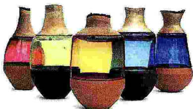
Contenitori Serie di vasi in rame e vetro colo- rato «Stacking vessels» di Pia Wustenberg, 2013